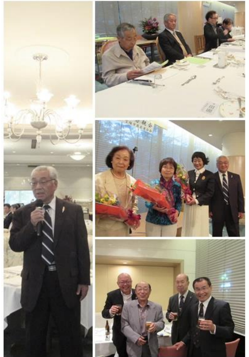
のご提供をいただきました。どうもありがとうございました。

スポンサー賞として 宝塚ワシントンホテル様より「ケーキセットペアチケット」10組 宝塚ハム工房様よりハム詰め合わせ2組