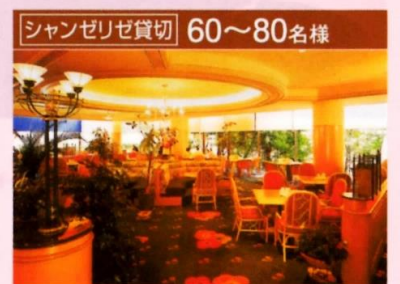
シャンゼリゼ貸切 60~80名様