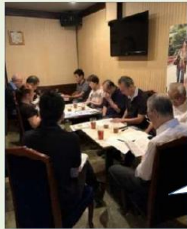
会長が経営する居酒屋で開催