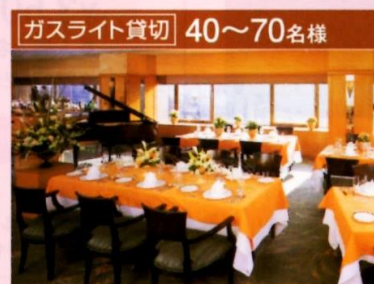
ガスライト貸切 40~70名様