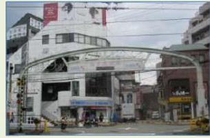
宝塚市川面5丁目 JR宝塚駅北側

JR宝塚駅から徒歩3分以内で38店舗が営業する、横に細長い路面型商店街です。商店街の中に地域包括支援センターもあります。